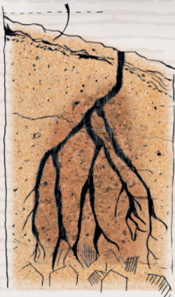
Tipo de suelo

Notas Técnicas Acidez Total: 3,82 g/l PH: 3.42 Azúcar residual: 2.88 g/l Alcohol: 14 %